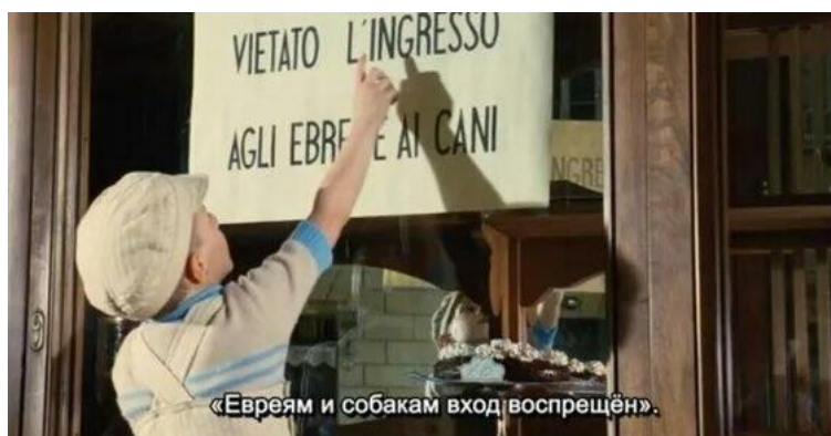
(кадр из кинофильма «Жизнь прекрасна» 1997г.)

Данный тип сегрегации — это также форма дискриминации по национальным, религиозным, расовым или другим признакам. Особенно жесткие формы он принимал во времена нацистского режима в Германии.